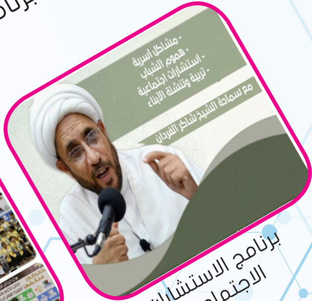
برنامج الاستشارات الاجتماعية