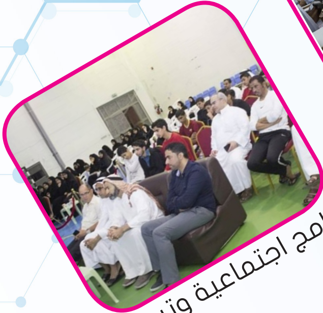
برامج اجتماعية وتربوية