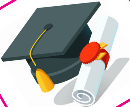
مساعدة رسوم الجامعة