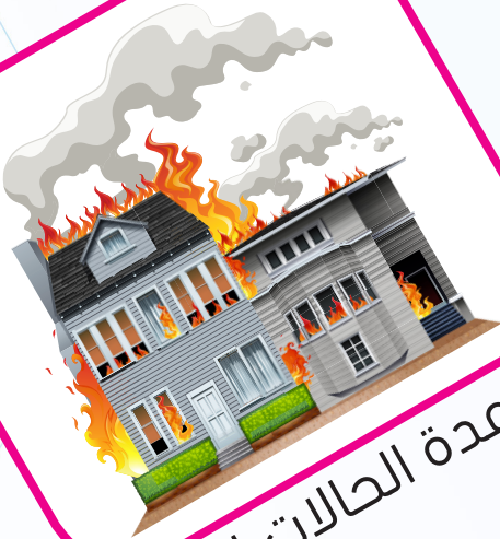
مساعدة الحالات الطارئة