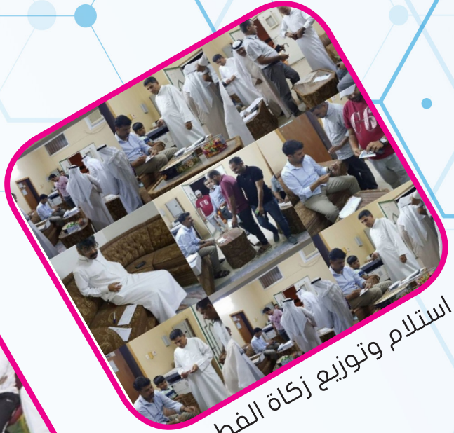
استلام وتوزيع زكاة الفطرة