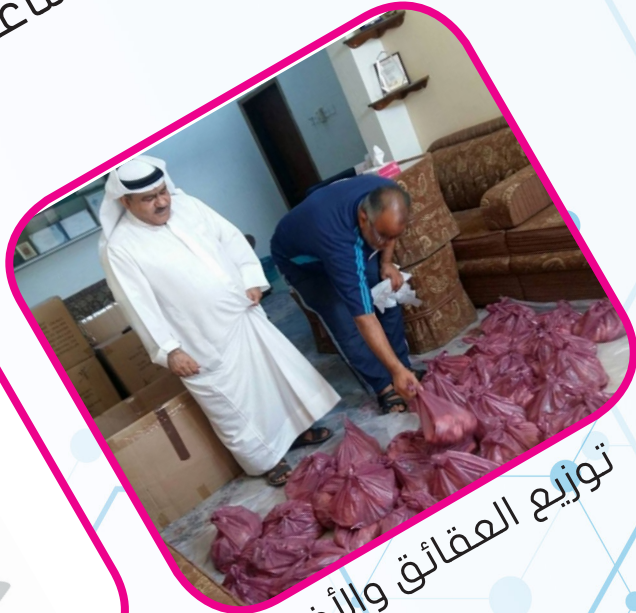
توزيع العقائق والأضاحي