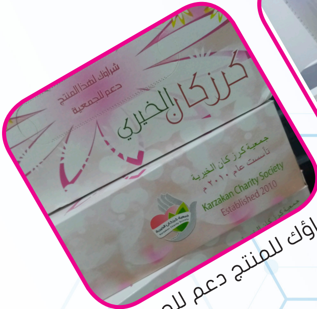
شراؤك للمنتج دعم للجمعية