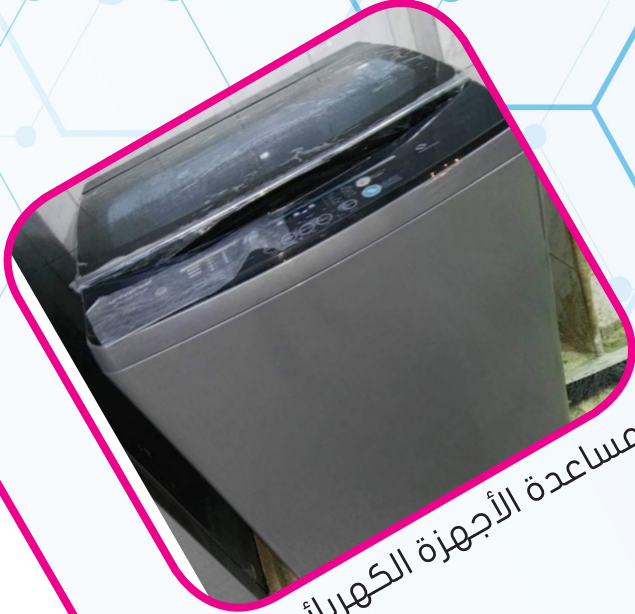
مساعدة الأجهزة الكهربائية