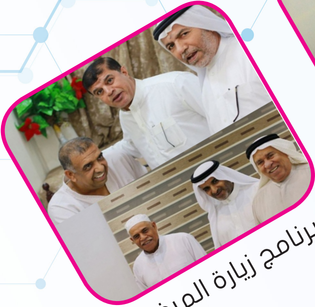
برنامج زيارة المرضى