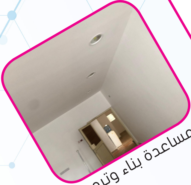
مساعدة بناء وترميم